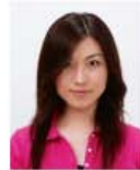
前髪が目元にかかっているもの