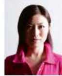
顔に影があるもの