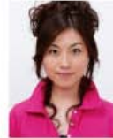
上部余白がないもの